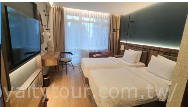
☆豪華 Krestovaya Pad 十字谷飯店 http://en.krestovayapad.ru/