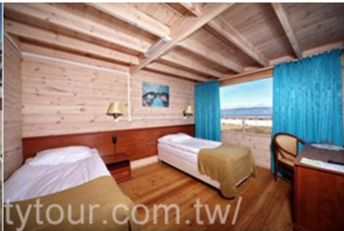
☆ Hotel Baikal 貝加爾湖飯店 https://eastland-baikal.ru/ru