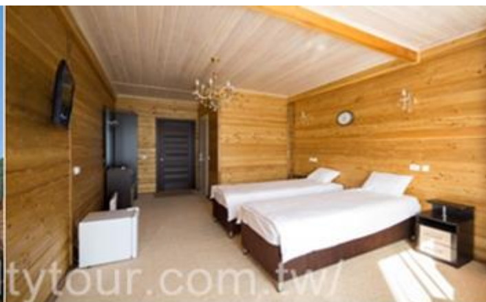
☆烏蘭烏德五星級 Hotel Mergen Bator http://mergenbator.ru/eng/