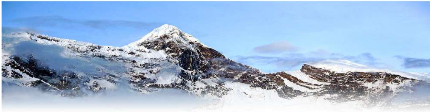
南迦巴瓦峰 / 西藏最古老的佛教“雍仲本教”的聖地 南迦巴瓦峰它還有另一個名字“木卓巴爾山”，其巨大的三角形峰體終年積雪，雲霧繚繞，從不輕易露出真面目，所以它也被稱為“羞女峰”。南迦巴瓦在藏語中有多種解釋，一為“雷電如火燃燒”，一為“直刺天空的長矛”，還有一為“天山掉下來的石頭”。

林芝地區米林縣墨脫縣交界地帶，海拔 7,782 公尺，也是世界所有高度超過 7,600 公尺的山峰中位置最靠近東方的。南迦巴瓦峰曾被《中國國家地理》雜誌評為「中國最美十大名山」第一名。