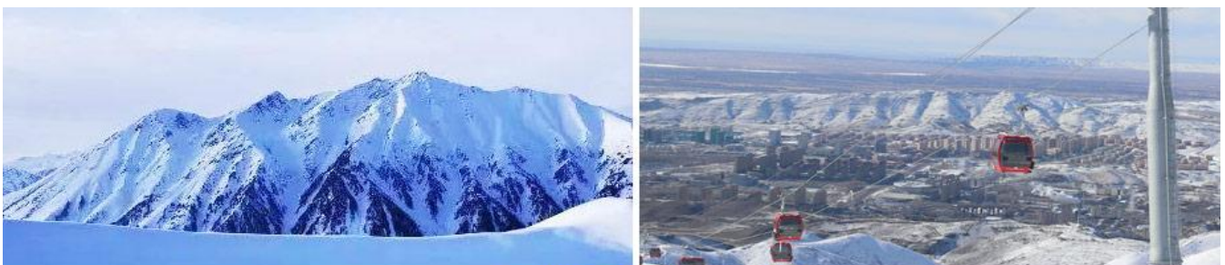
禾木吉克普林-雲霄峰

當纜車到達山頂，連綿不絕的阿爾泰山脈重巒疊嶂，禾木吉克普林的美景盡收眼底。纜車觀光跨越兩個季節，遊客們直呼“不虛此行”。所以我們特別選擇在喀納斯旅遊不要趕行程。這樣安排才是最完美的。