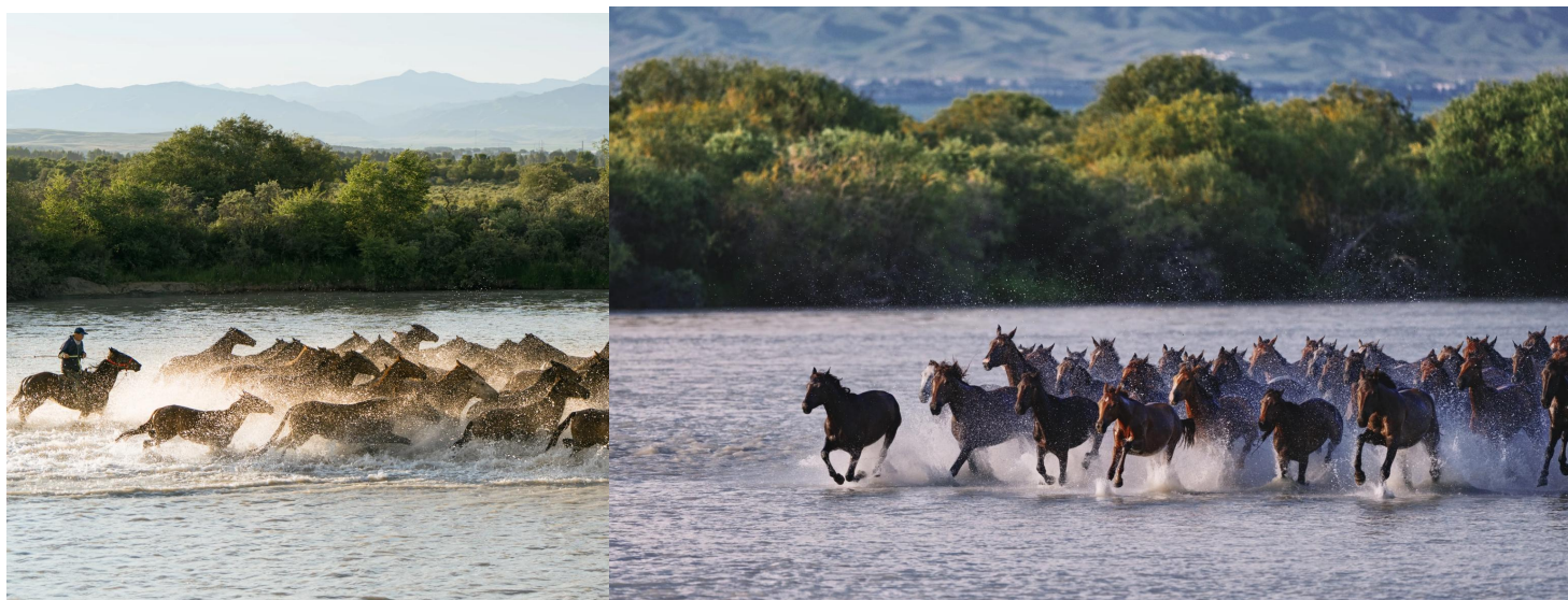
伊犁有個昭蘇縣 昭蘇「天馬浴河」精采絕倫

昭蘇縣西與哈薩克交界，西南鄰近吉爾吉斯斯坦，縣境內有大陸國家一級口岸——木紮爾特口岸。昭蘇出駿馬，轄內有 6 個國營牧場，居住著哈、漢、蒙、維等 21 個民族；被漢武帝