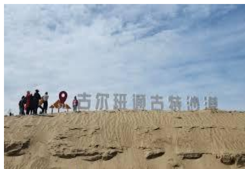
古尔班通古特沙漠 gǔ ěr bān tōng gǔ tè shā mò