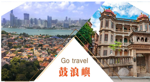
與廈門市隔海相望，因海西南有海蝕洞受浪潮衝擊，聲如鑼鼓，明朝雅化為今名。由於歷史原因，中外風格各異的建築物在此地被完好地匯集、保留，有“萬國建築博覽”之稱。小島還是音樂的沃土，人才輩出，鋼琴擁有密度居全國之冠，又得名“鋼琴之島”、“音樂之鄉”。